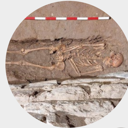
Excavacions arqueològiques a la base del campanar.

Al nivell de la volta, s'ha consolidat el paviment de pedres, ceràmica i calç existent, respectant els materials i tècniques històriques. L'accés al campanar des de la nau també s'ha millorat amb la col·locació d'una nova porta de fusta i la regularització dels paraments de l'entrada. Finalment, s'ha renovat completament la instal·lació elèctrica i d'enllumenat.