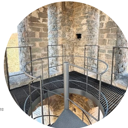
Segon nivell amb les finestres geminades.

Durant el segle XIX es van construir coberts annexos i es van consolidar elements funcionals. Després de l'incendi de 1936, que va afectar la nau i diversos revestiments interiors, es van dur a terme obres de restauració que van incloure la neteja i revestiment de parets, la reparació del paviment i la reconstrucció de l'absidiola sud. També, la construcció d'un nou altar i púlpit, així com l'ampliació i acondicionament de la rectoria.