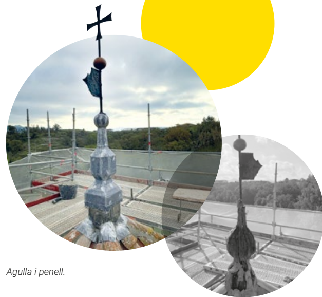
Agulla i penell.

Els treballs de restauració també han reubicat els nivells de circulació intermedis, col·locant sostres lleugers d'acer que respecten les cotes originals i permeten percebre tot el volum interior de la torre fins al cos de campanes. El nivell superior, corresponent a l'antic cos romànic, s'ha concebut com un espai visitable, amb una escala de cargol que connecta amb la volta inferior i un últim nivell, destinat a tasques de manteniment, format per una estructura metàl·lica lleugera que permet veure la coberta de la torre des de sota.