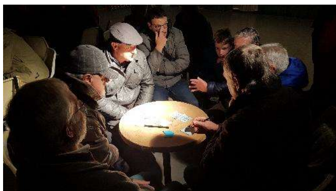
Un grup d'assistents durant l'exercici participatiu