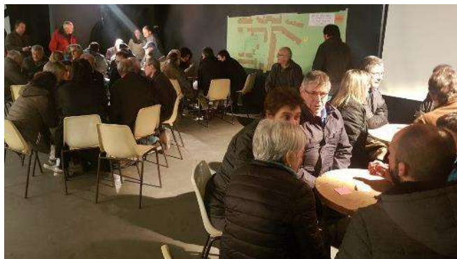
Grups en debat simultani durant l'exercici participatiu