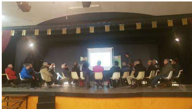
El treball participatiu es va realitzar damunt de l'escenari de la sala d'actes de la Cooperativa